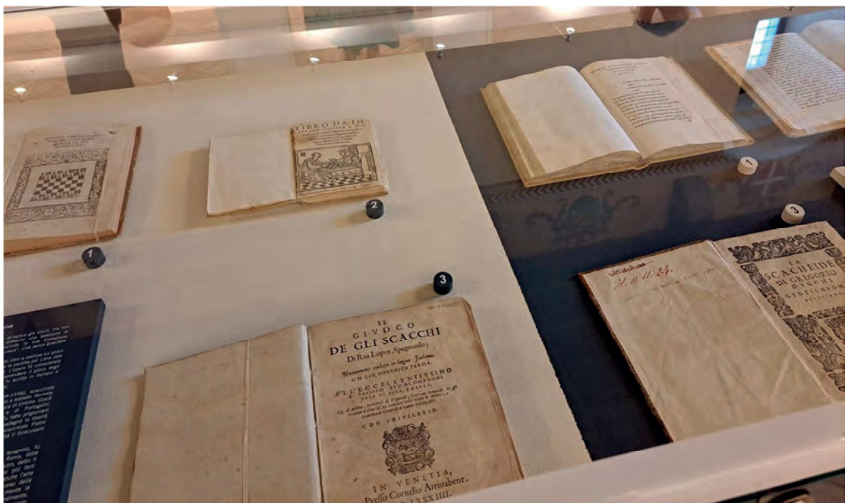
Alcune delle opere esposte, in primo piano: “Il giuoco de gli scacchi” (1584) di Ruy Lopez de Segura.

A guidare tra i contenuti della sezione della Biblioteca riservata al gioco degli scacchi, è un manoscritto di piccolissime dimensioni, redatto nell'Ottocento dai bibliotecari Ignazio Savi e Andrea Capparozzo, contenente il censimento bibliografico dei libri sul gioco degli scacchi all'epoca patrimonio della Biblioteca vicentina. Quell'inventario è stato in seguito ampliato a livello di bibliografia specialistica e pubblicato integralmente dal dottor Diego D'Elia nel 2021 che per primo ne comprese l'importanza storica.