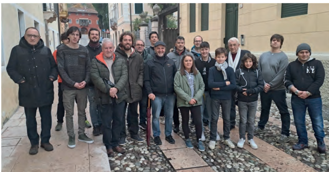
Organizzatori e partecipanti al torneo lampo del 10 dicembre 2022.