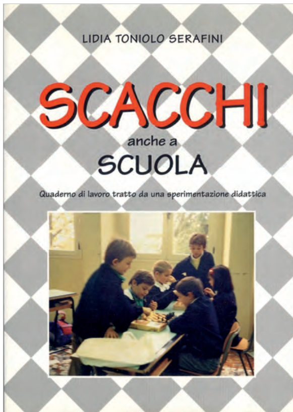
Stampato nel 1997