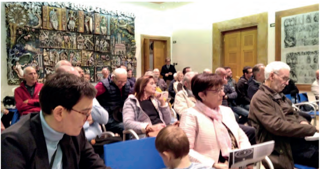
Scorcio del folto pubblico, circa un centinaio di persone.