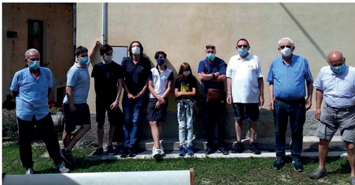
(ALCUNI PARTECIPANTI ALLO STAGE A POSINA DEL 2021)

GIORNATE DI SCACCHI IN ALLEGRIA E STUDIO