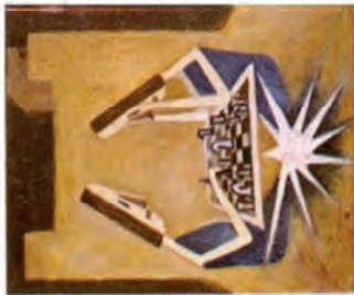
Circolo Scacchistico "Città di Marostica" - A.S.D.