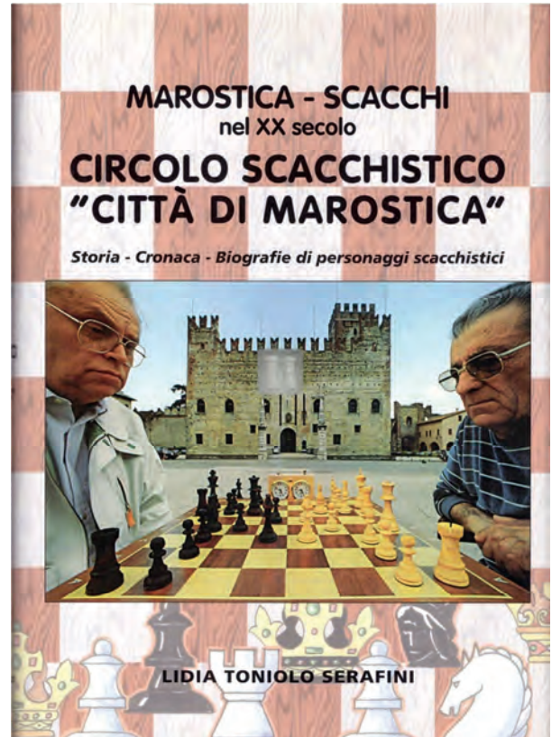
Stampato nel 2000

Libretto del XXV Anniversario del Circolo Scacchistico "Città di Marostica"