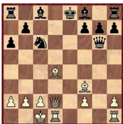
Posizione dopo 13. ... ♖c6

1.e4 c5 2.♘f3 ♘f6 3.♘c3 d5 4.exd5 ♘xd5 5.d4 e6 6.♘xd5 ♚xd5 7.♙e3 cxd4 8.♘xd4 a6 una perdita di tempo, era meglio sviluppare i pezzi minori 9.♙e2 un sacrificio di pedone per un grande vantaggio di sviluppo 9...♚xg2?! molto rischiosa 10.♙f3 ♚g6?! 11.♚d2 tre pezzi ben sviluppati sono un buon compenso per il pedone 11...e5? nessun pezzo minore del nero è in gioco 12.0-0-0! il giocatore più sviluppato deve aprire la posizione, questo è ciò che Paul Morphy ci ha insegnato con le sue partite e con 12.0-0-0 il Bianco sacrifica correttamente un pezzo per aprire la posizione 12...exd4 13.♙xd4 ♘c6 (vedi diagramma) 14.♙f6! bella mossa, apre la colonna d 14...♚xf6 [se 14...♙e7 15.♙xc6+ bxc6 16.♚d8+!]