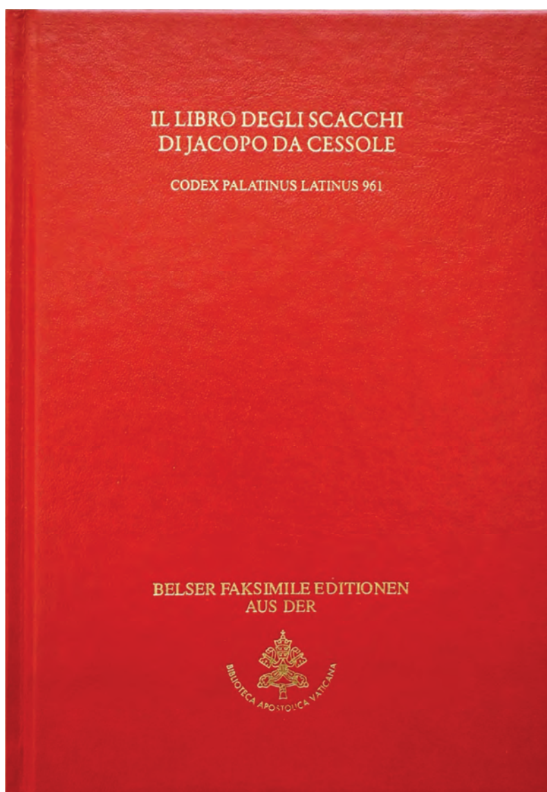
Piatto anteriore del volume di commento all'edizione facsimile edita dalla Società Scrinium nel 2011.

I dati biografici giuntici sono rintracciabili solo in pochi documenti, tutti relativi al secondo e terzo decennio del XIV secolo, che si riferiscono con buona certezza all'ultimo periodo della sua vita.